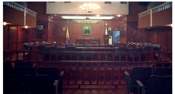
Asamblea Departamental del Valle del Cauca