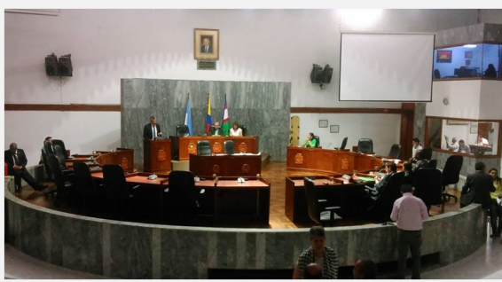
Concejo Municipal de Santiago de Cali