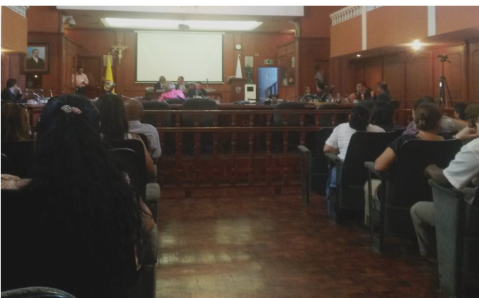
Asamblea Departamental del Valle Sesión de Control Político