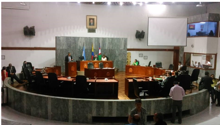
Concejo Municipal de Santiago de Cali Sesión de Control Político