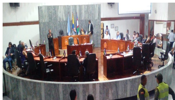
Concejo Municipal de Santiago de Cali Sesión de Control Político

(Artículos del reglamento interno que comúnmente se incumplen: 57, 72, y 77)