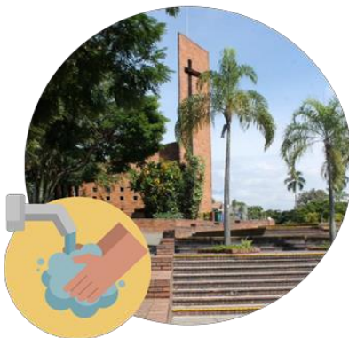
1. Acceso al Campus

La Universidad identifica tres grandes momentos de interacción de las personas entre sí en el desarrollo de las actividades académicas y administrativas. listados a continuación: