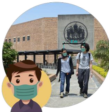
2. Desarrollo de actividades