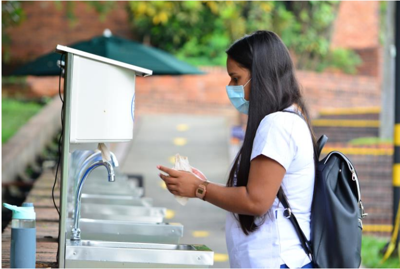
Imagen 1. Lavamanos portátiles en acceso al campus.

Todas las personas pueden asistir al campus universitario, lo que involucra a Estudiantes, Profesores, directivos, personal administrativo, contratistas y proveedores autorizados, teniendo en cuenta lo establecido en el Programa de Vigilancia para la Prevención, Detección, Control y Manejo de casos por riesgos asociados a COVID-19, partiendo de que el requisito principal a considerarse durante el ingreso es no presentar síntomas asociados a COVID-19 y mantener adherencia a los 6 hábitos fundamentales de prevención y protección de las personas.