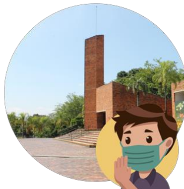
3. Salida del Campus